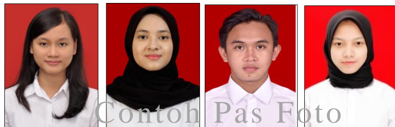
Contoh Foto Benar