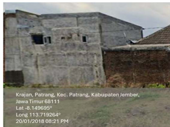
Foto rumah menggunakan aplikasi "Time Stamp Camera" dengan ketentuan :