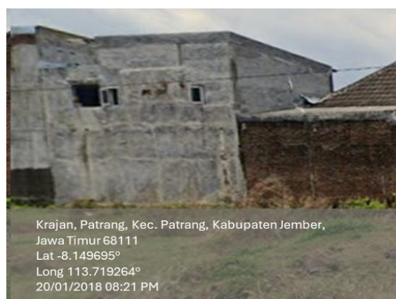
Foto rumah menggunakan aplikasi “Time Stamp Camera” dengan ketentuan :