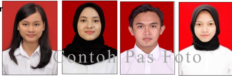
Contoh Foto Benar